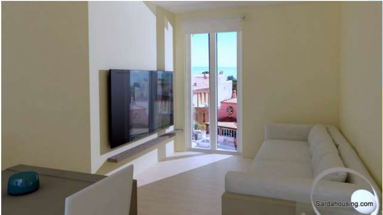
11 - Cala Gonone – Dorgali – Appartamenti Vasco