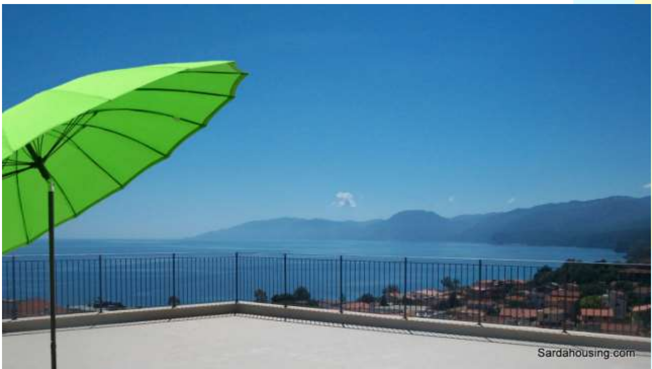
4 - Cala Gonone – Dorgali – Appartamenti Vasco: vista dalla terrazza solarium