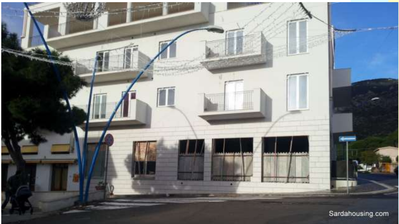
24 - Cala Gonone – Dorgali – Appartamenti Vasco: l'edificio riqualificato