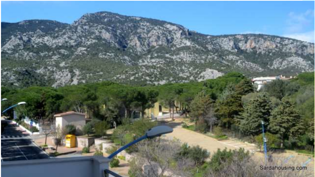
23 - Cala Gonone – Dorgali – Appartamenti Vasco: vista dalla terrazza solarium