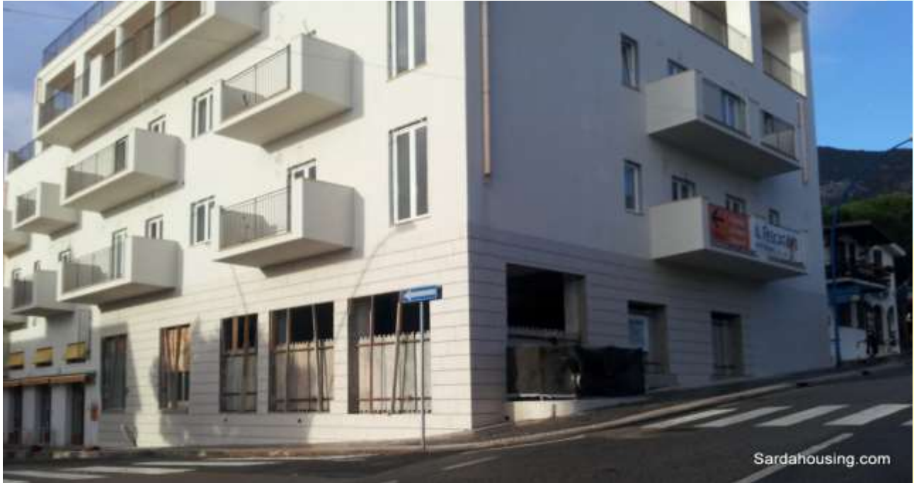
25 - Cala Gonone – Dorgali – Appartamenti Vasco: l'edificio riqualificato