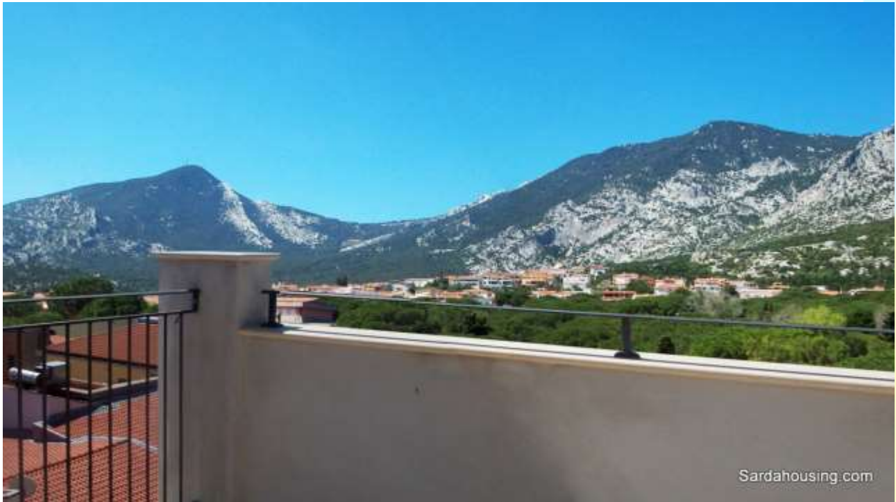
5 - Cala Gonone – Dorgali – Appartamenti Vasco: vista dalla terrazza solarium