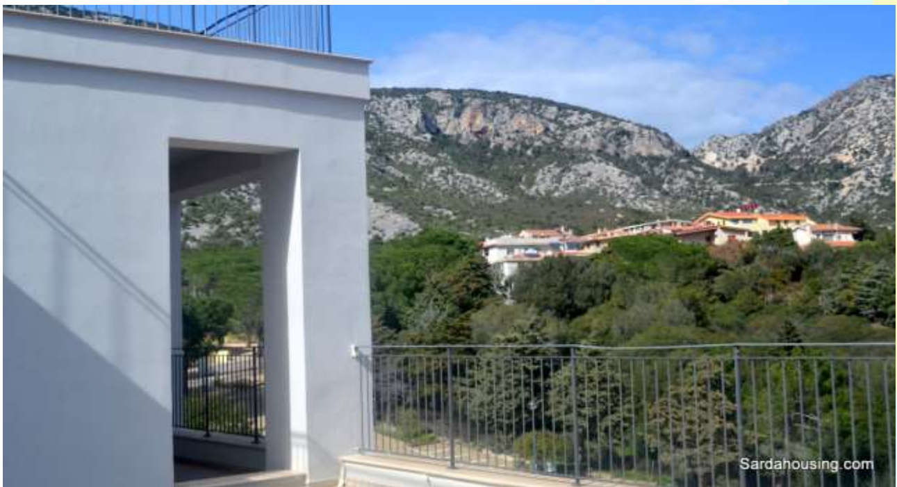
6 - Cala Gonone – Dorgali – Appartamenti Vasco: vista dall'attico