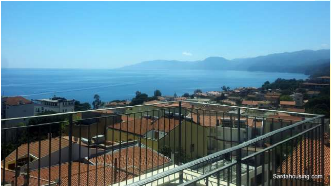
3 - Cala Gonone – Dorgali – Appartamenti Vasco: vista dall'attico