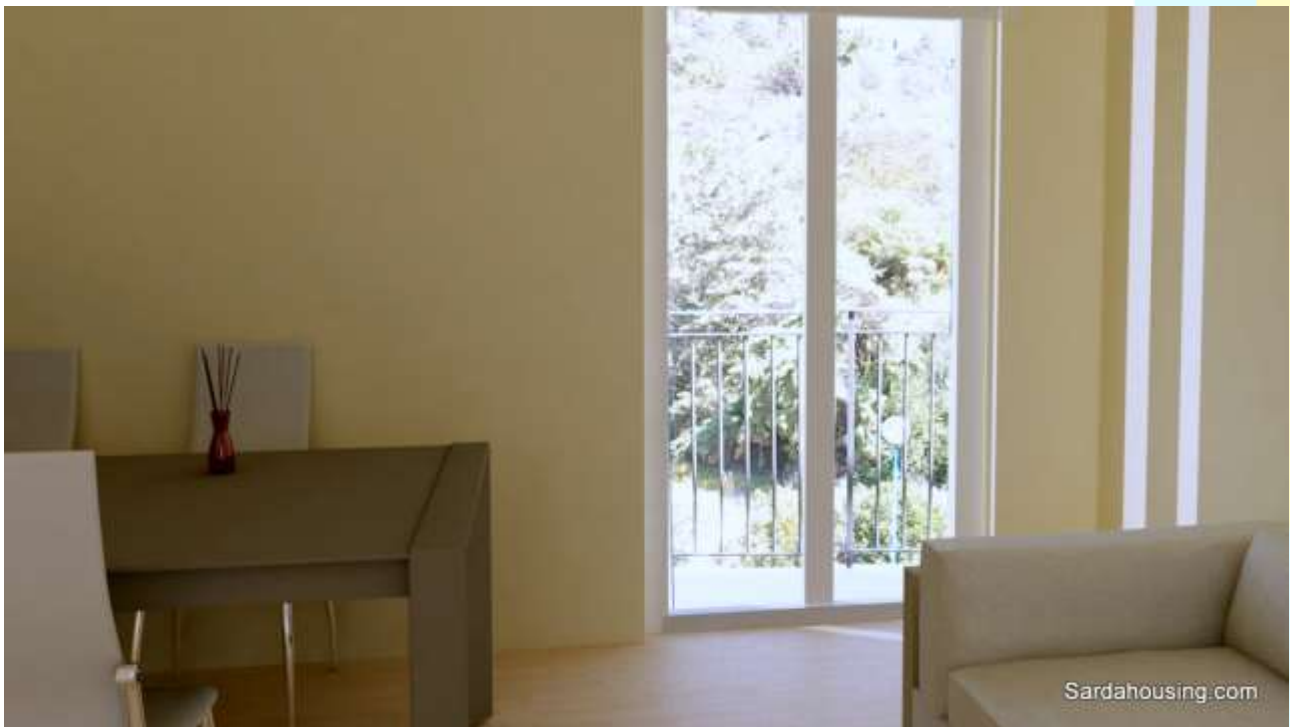
10 - Cala Gonone – Dorgali – Appartamenti Vasco