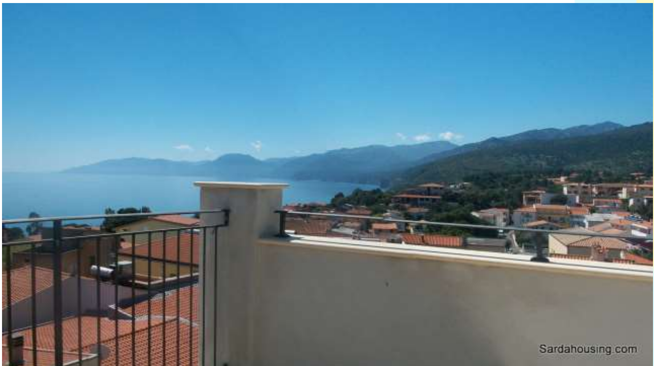
20 - Cala Gonone – Dorgali – Appartamenti Vasco: vista dalla terrazza solarium