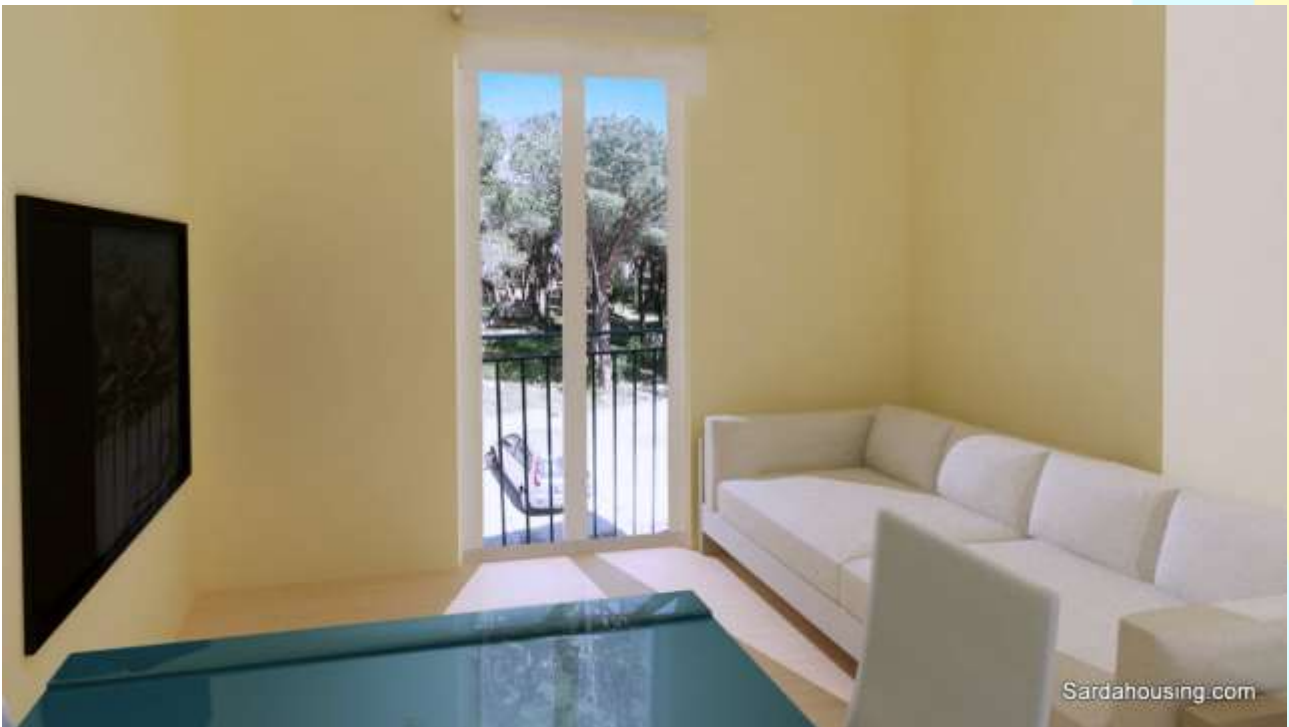
8 - Cala Gonone – Dorgali – Appartamenti Vasco