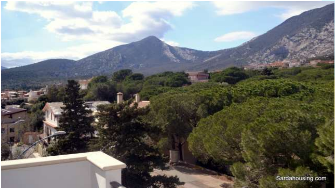
19 - Cala Gonone – Dorgali – Appartamenti Vasco: vista dall'attico