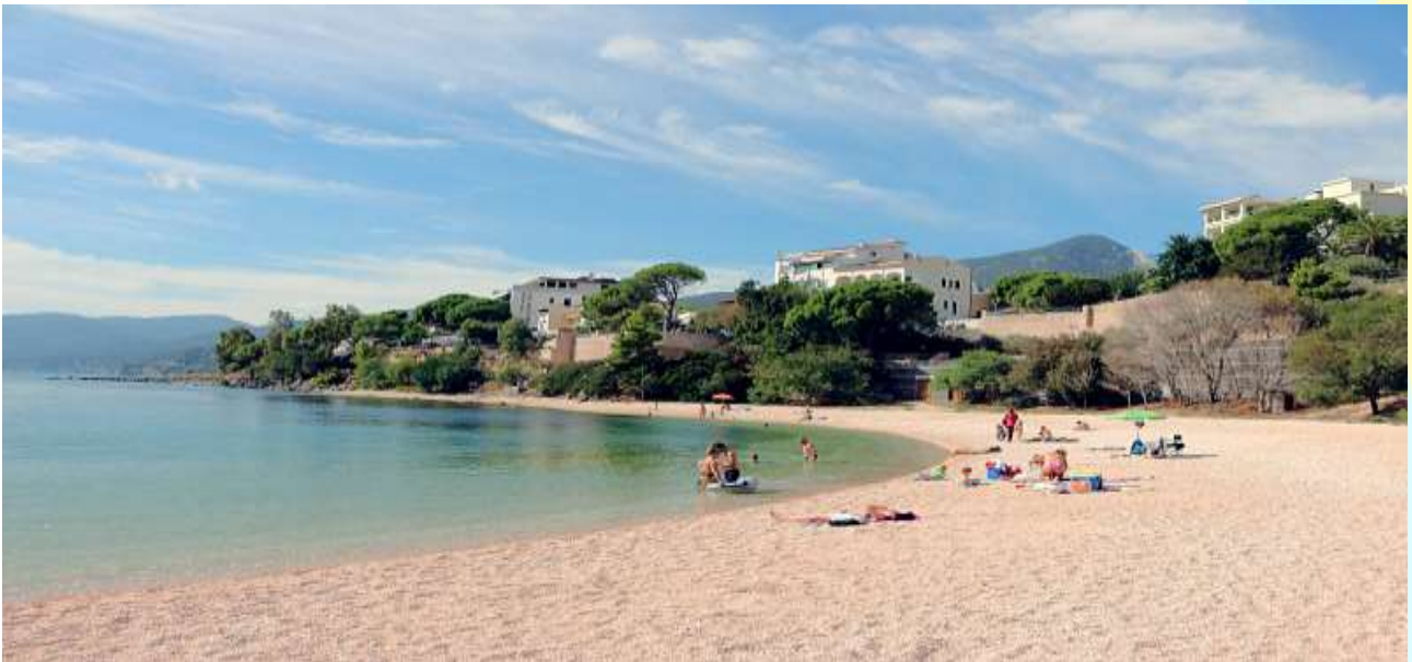
Spiaggia Centrale a Cala Gonone

Distanze: Dorgali 10 km; Nuoro: 39 km; Olbia porto e aeroporto: 107 km.