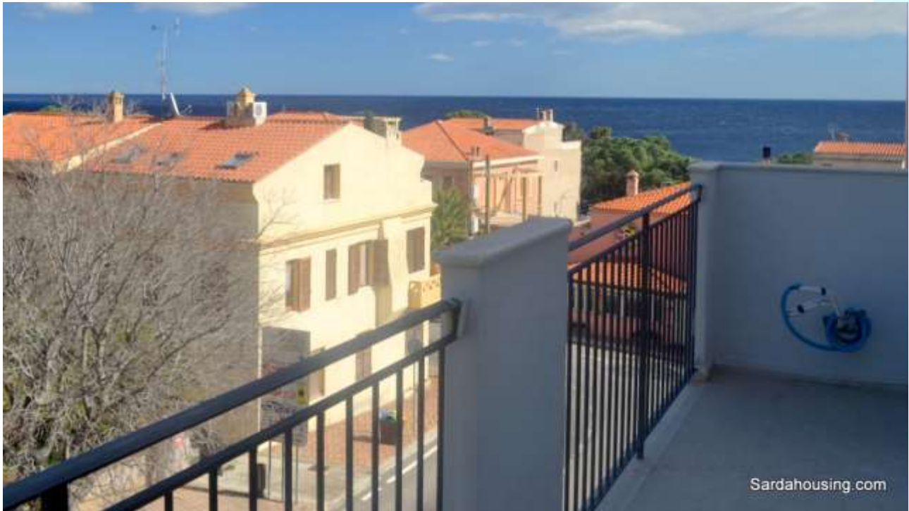
21 - Cala Gonone – Dorgali – Appartamenti Vasco: vista dalla terrazza solarium