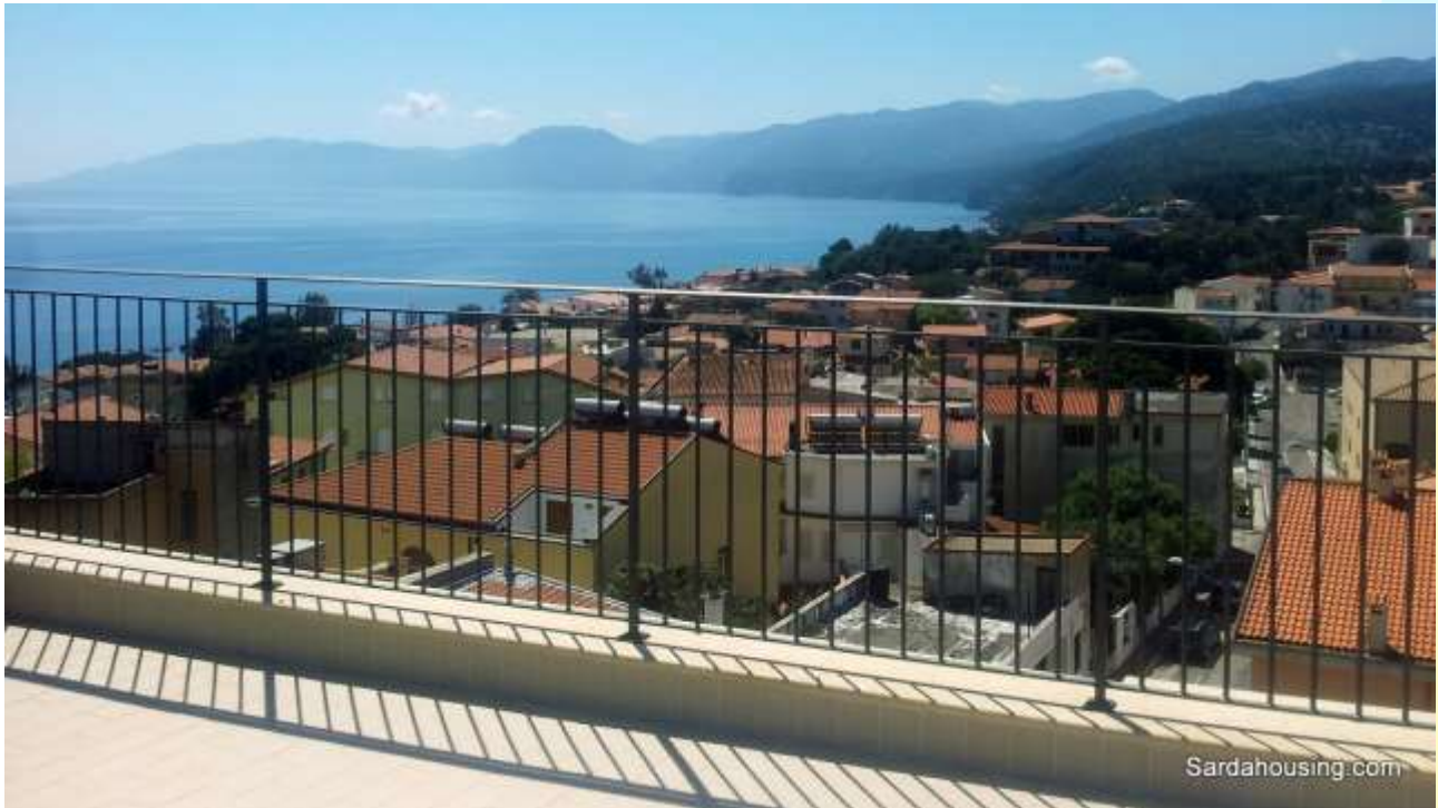
17 - Cala Gonone – Dorgali – Appartamenti Vasco: vista dalla terrazza solarium