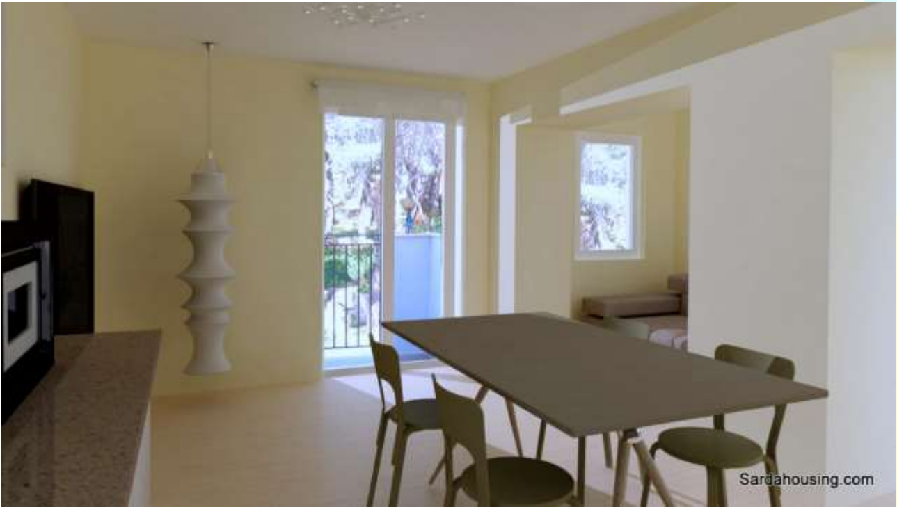
7 - Cala Gonone – Dorgali – Appartamenti Vasco