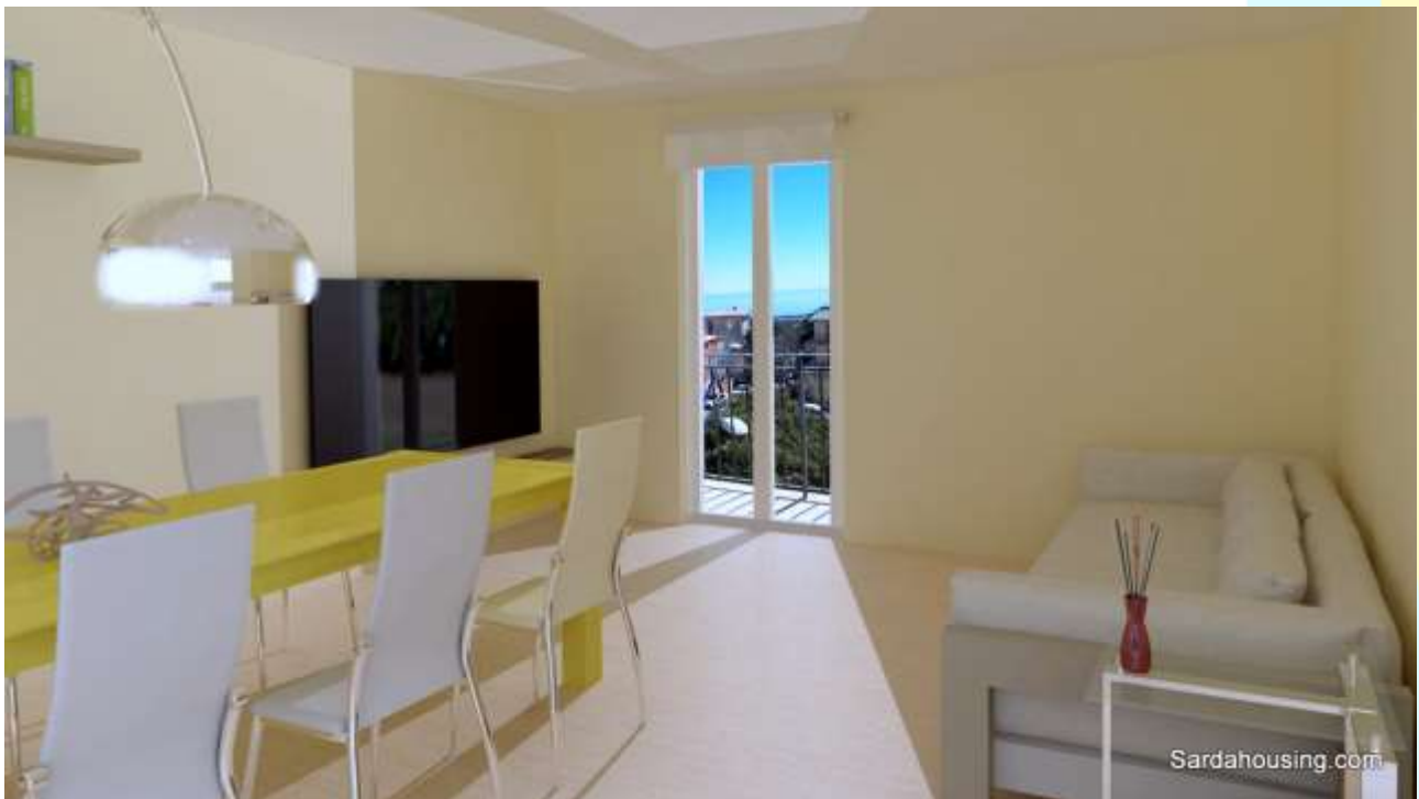
12 - Cala Gonone – Dorgali – Appartamenti Vasco