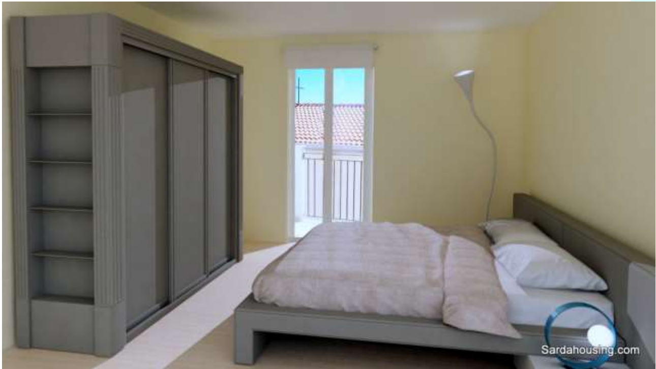
13 - Cala Gonone – Dorgali – Appartamenti Vasco