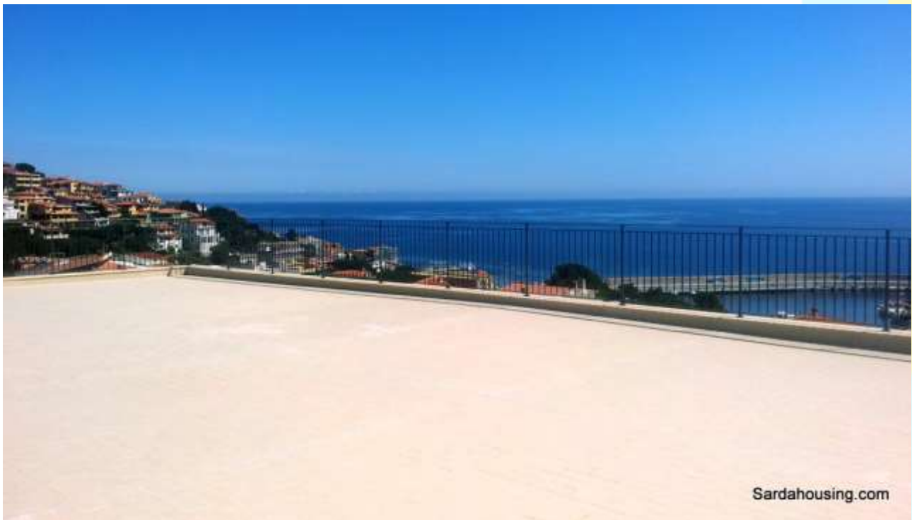
14 - Cala Gonone – Dorgali – Appartamenti Vasco: vista dalla terrazza solarium