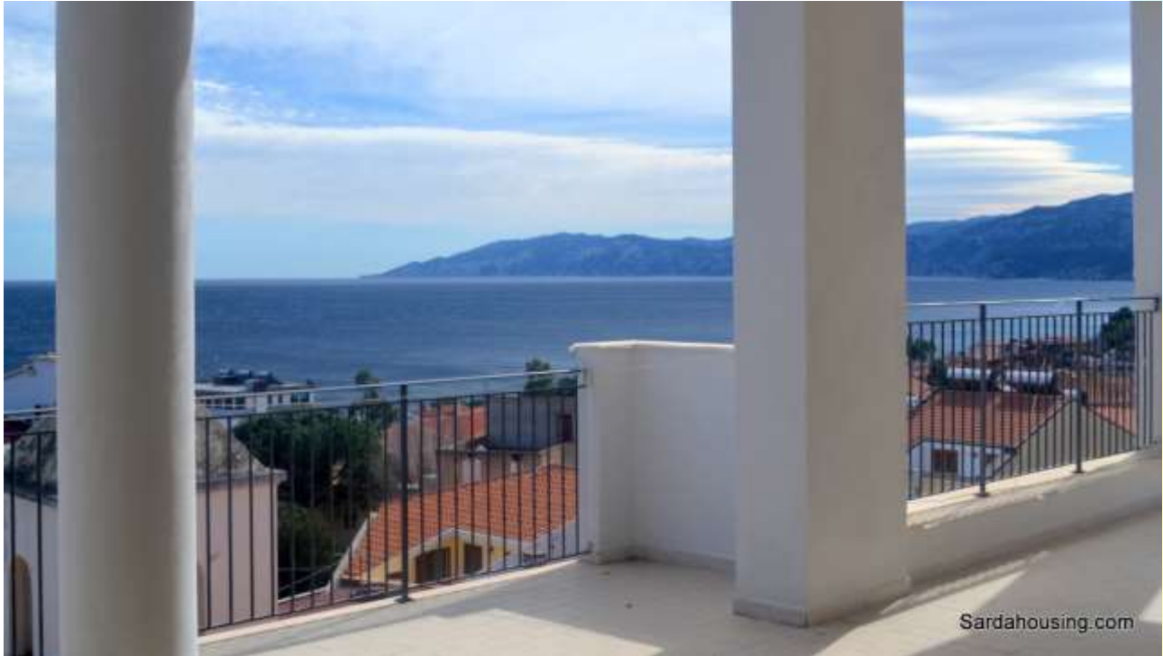
2 – Cala Gonone – Dorgali – Appartamenti Vasco: vista dall'attico