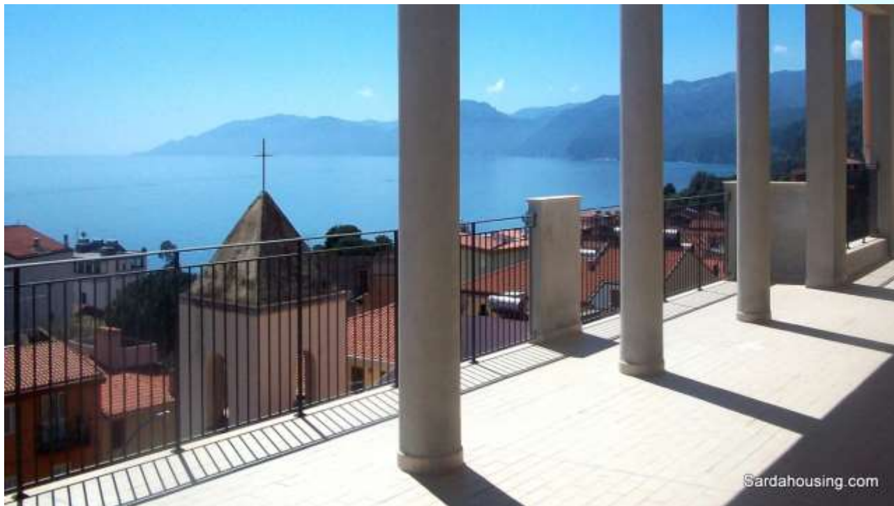
1 – Cala Gonone – Dorgali – Appartamenti Vasco: vista dall'attico

A Cala Gonone , una delle località più note sulla costa orientale della Sardegna , vi proponiamo dei magnifici attici panoramici a 150 metri dalla spiaggia .