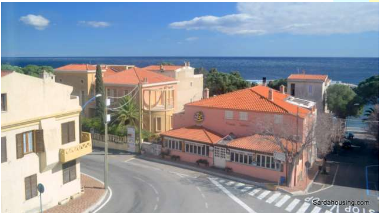
22 - Cala Gonone – Dorgali – Appartamenti Vasco: vista dall'attico