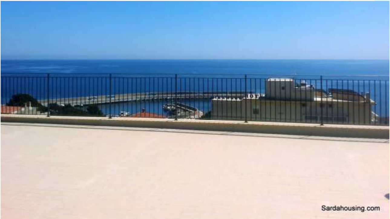
15 - Cala Gonone – Dorgali – Appartamenti Vasco: vista dalla terrazza solarium