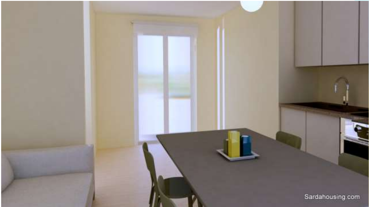
9 - Cala Gonone – Dorgali – Appartamenti Vasco